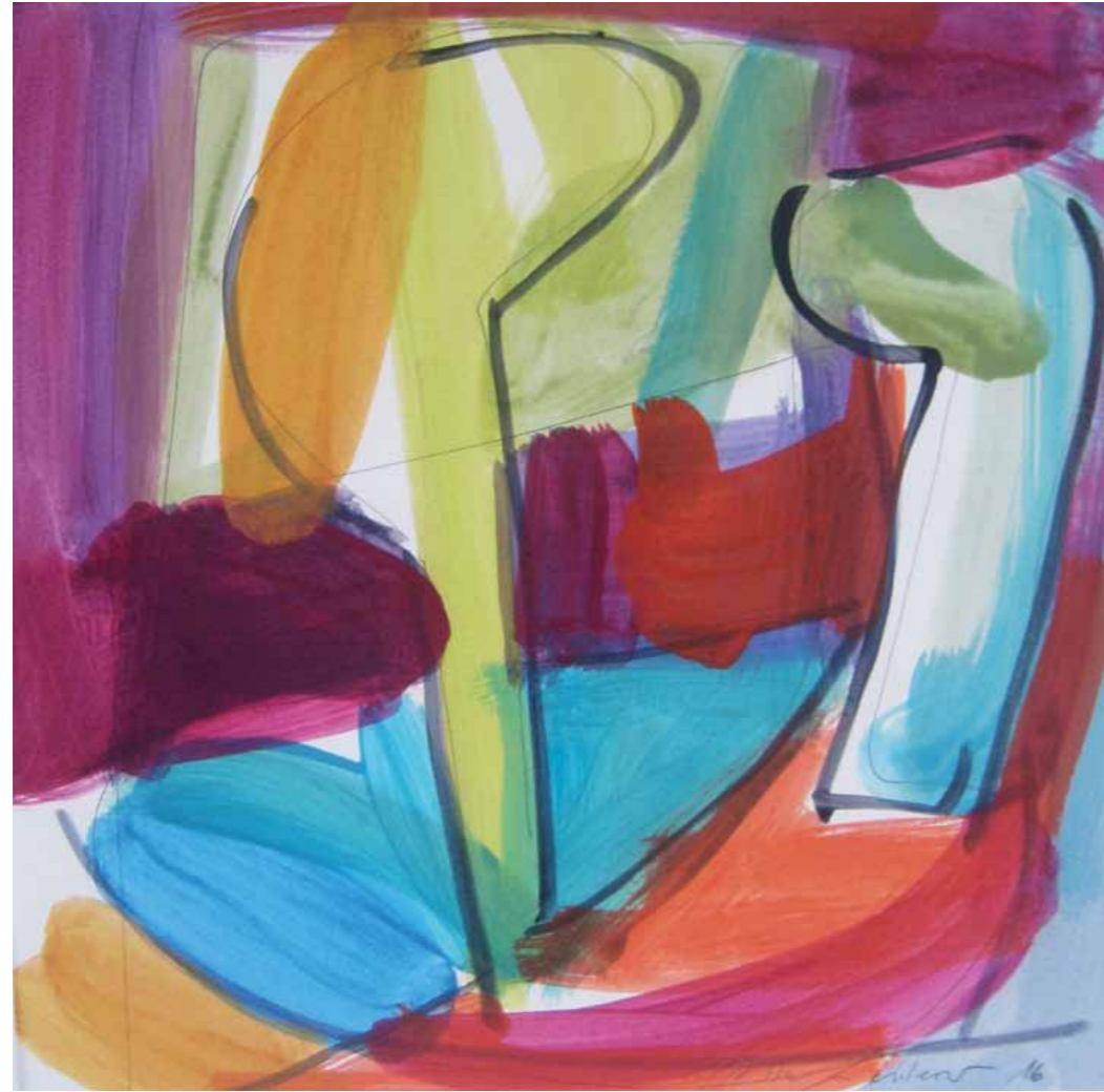
„Landschaftstruktur“ Mischtechnik auf Karton 40 x 40 cm 2016