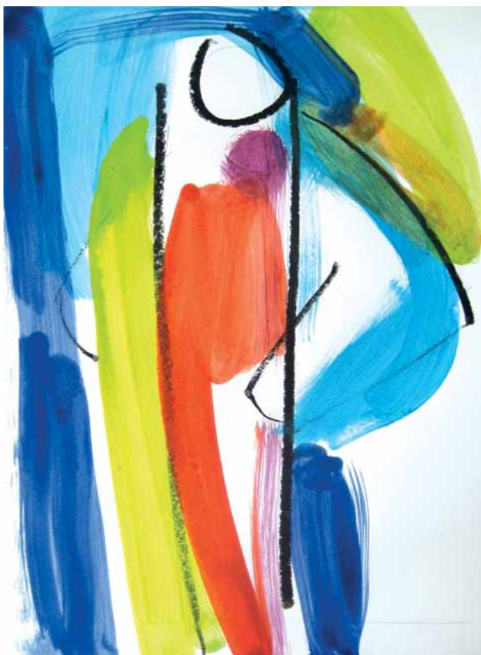
„Klarwerden“ Mischtechnik auf Karton 29,5 x 21 cm 2017