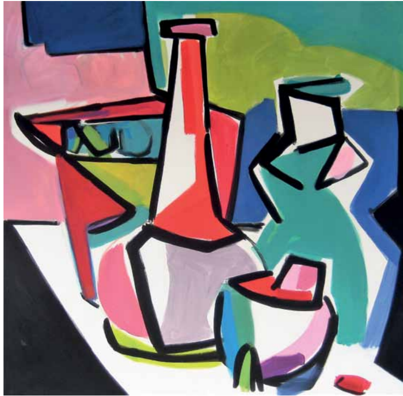
„Versammlung“ Acryl auf Leinwand 190 x 190 cm 2017