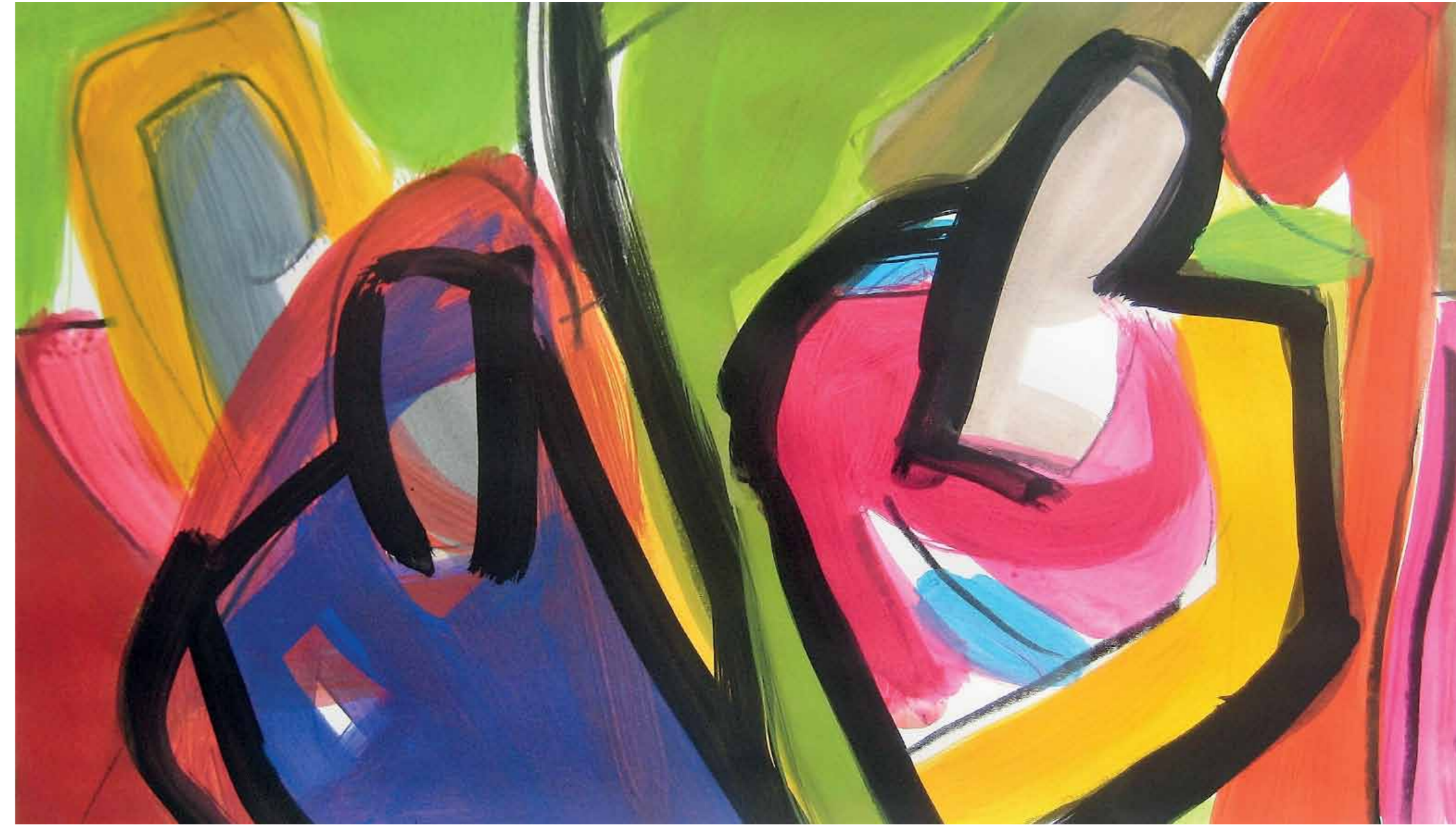
„Wirklichkeiten“ Mischtechnik auf Karton 24 x 42 cm 2016