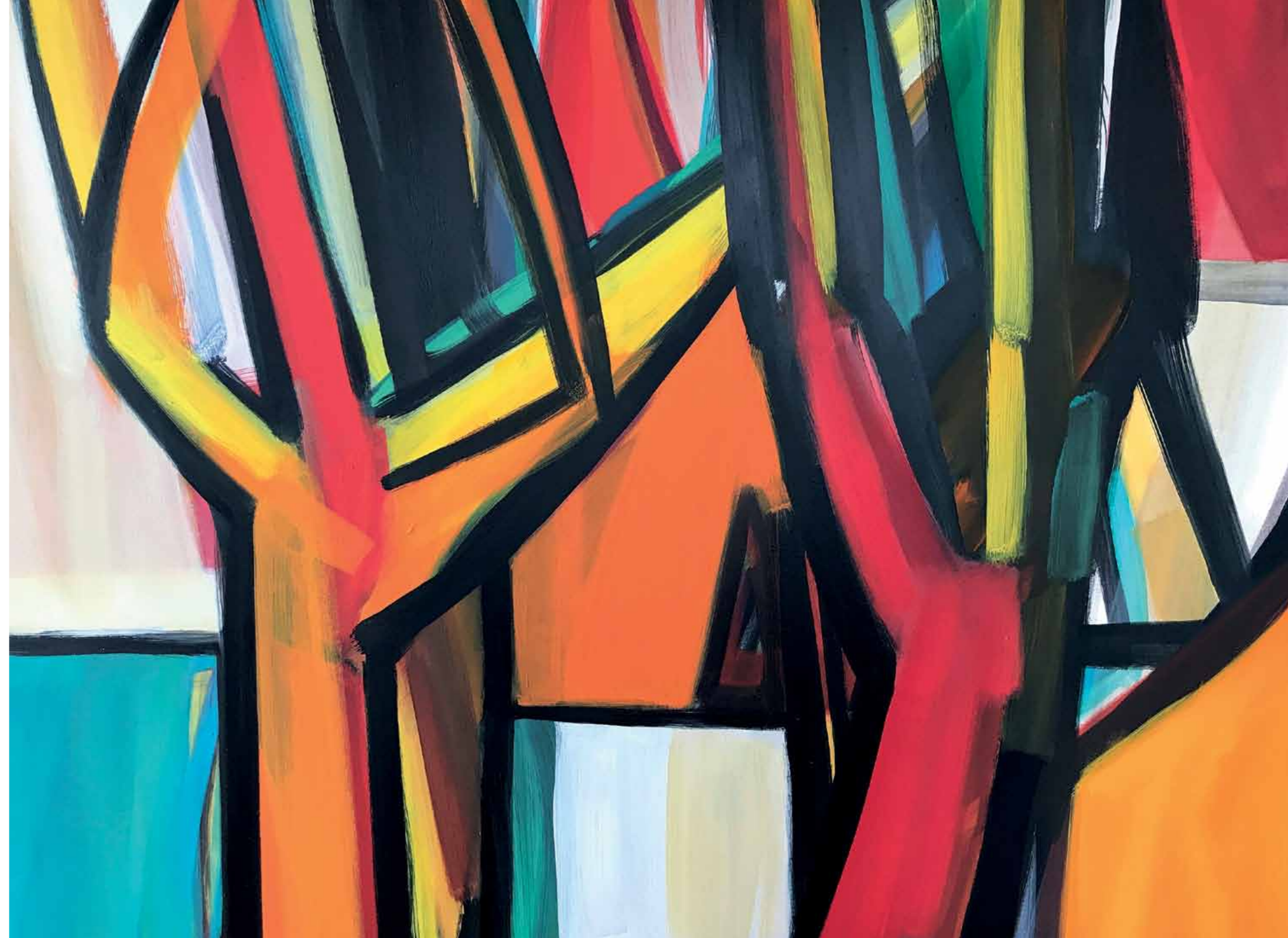
„Raumordnung“ Acryl auf Leinwand 120 x 160 cm 2017