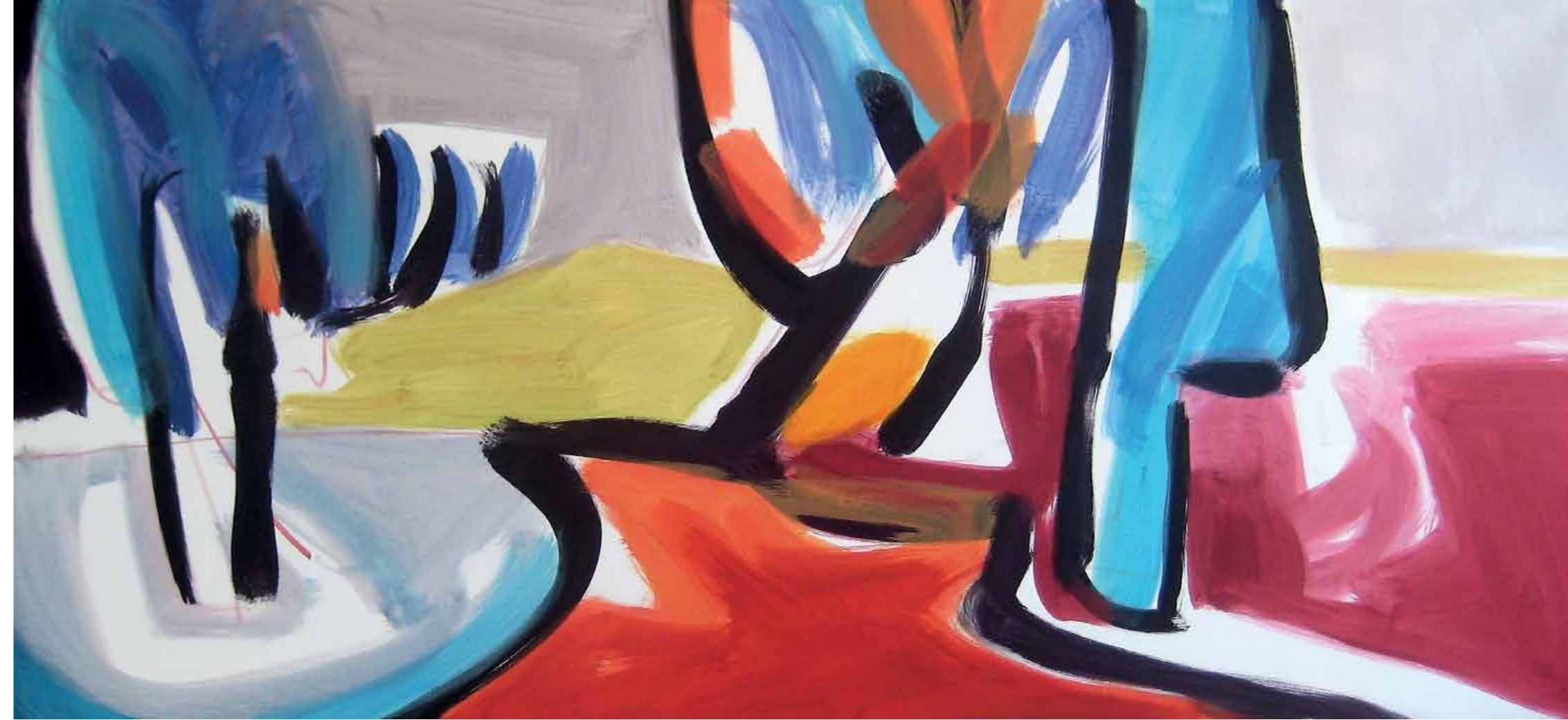
„Frost“ Acryl auf Leinwand 70 x 150 cm 2016