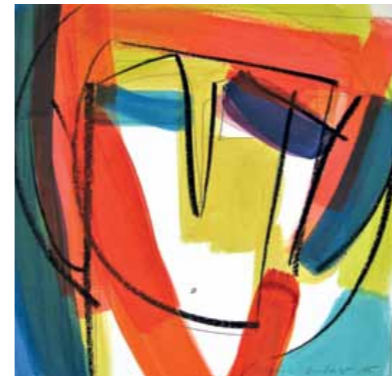
„Head Performance“ (Serie) Mischtechnik auf Karton 29 x 29 cm 2015