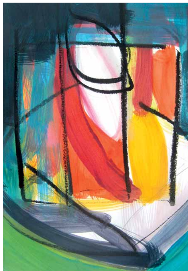
„Mittelpunkt“ Mischtechnik auf Karton 29,5 x 21 cm 2017

Mag.art. Antonia Riederer 4731 Prambachkirchen, Austria Schöffling 12 T +43 - (0)664 - 59 06 100