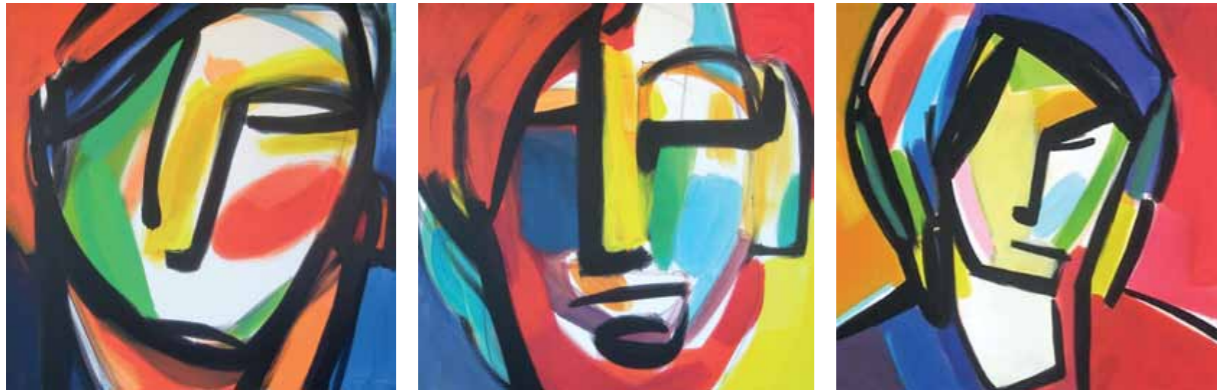
„Gesichtsstruktur I“ Acryl auf Leinwand 100 x 100 cm 2017